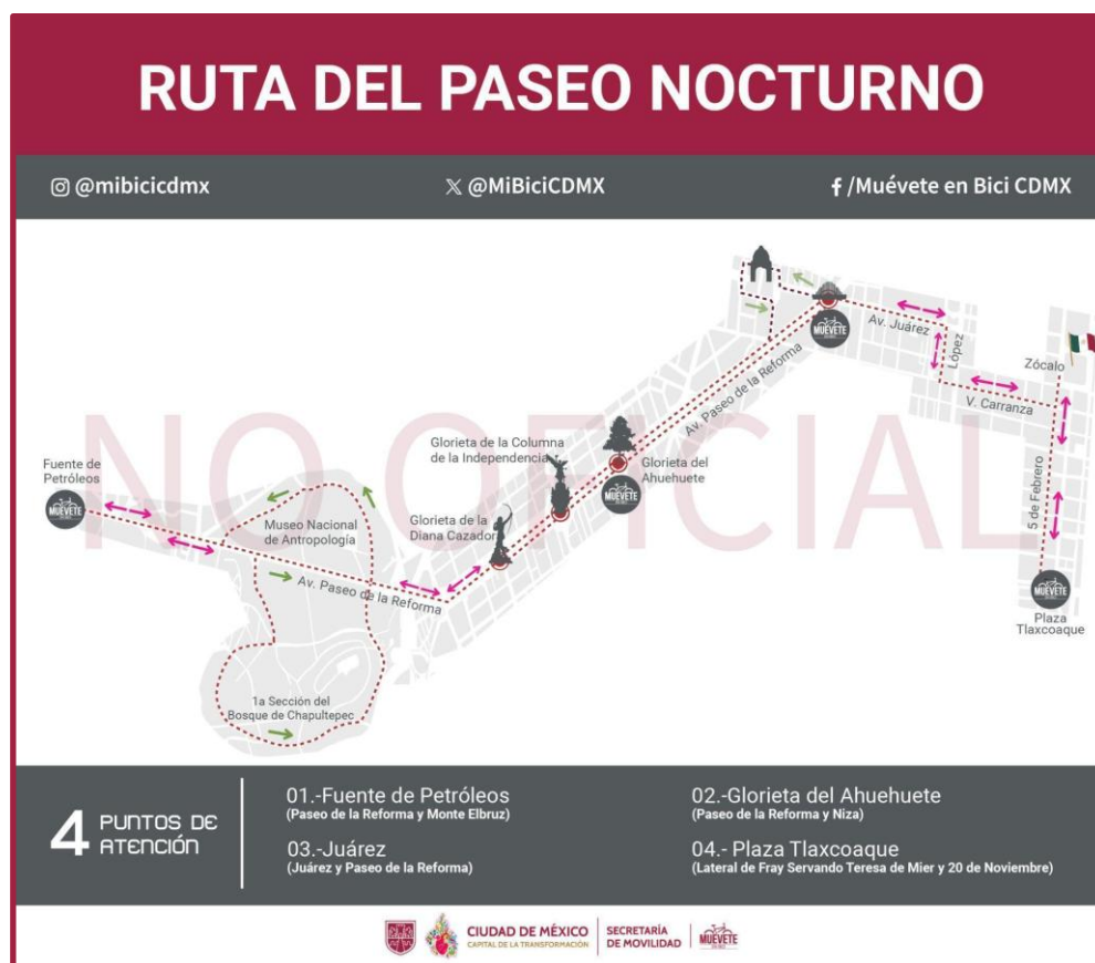
Mapa de la ruta Nocturna

“Por casos fortuitos, de fuerza mayor o contingencia puede cambiar la ruta u horario, información que se hará del conocimiento al Prestador del Servicio”